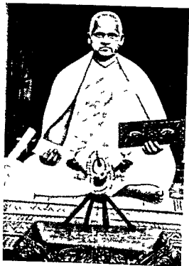
स्व० पृ. मुनिरानथी अमीविजयजी महागज